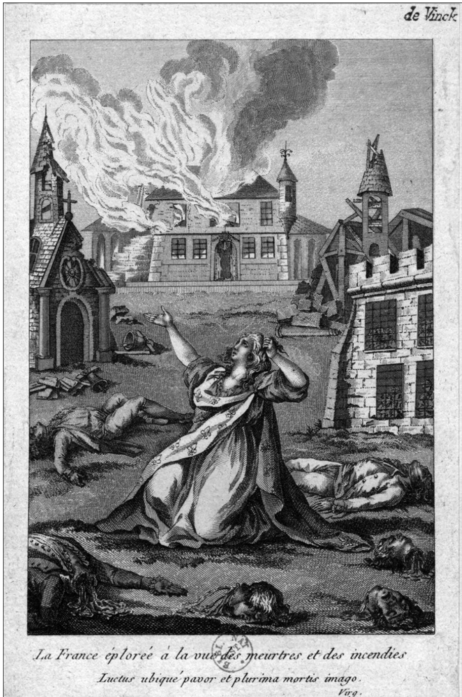
La France éplorée à la vue des meurtres et des incendies: Luctus ubique pavor et plurima mortis imago. Virg. [Paris?], [s. n.], [entre 1794 et 1799].